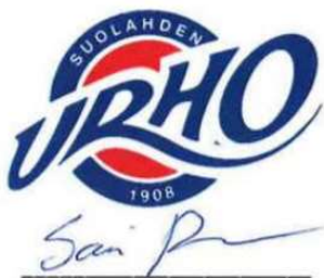
Sami Pekkala Toiminnanjohtaja